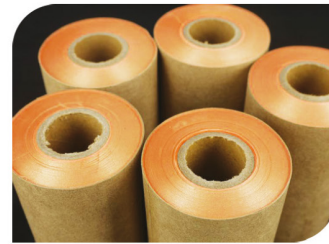
Kesilecek Folyo Bobinleri Cutting Foil Coils