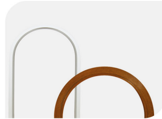
Büküm İşlemi Uygulanmış Profil Örnekleri The Profile Samples after the Bending Process